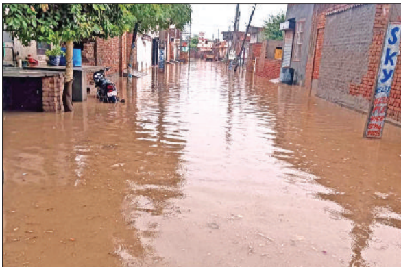
अगस्त तक चलाया जाएगा। इसके दवाओं की डिमांड भी कर दी है। ताकि किसी प्रकार की कोई