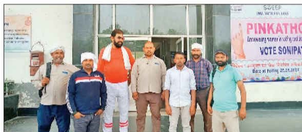
सोनीपत। ज्ञापन देने के लिये लघु सचिवालय पहुंचे मंच के पदाधिकारी।

ठेका सफाई कर्मचारी एकता मंच संबंधित मूल निवासी कर्मचारी कल्याण महासंघ सहयोग, बली सेना के तत्वावधान में कर्मचारियों ने वीरवार को उपायुक्त एवं नगर निगम आयुक्त को ज्ञापन सौंपा। ज्ञापन में पालिका, परिषद, नगर निगम में मैन पावर के ठेके पर लगे कर्मचारियों को पेट्रोल को पेट्रोल पर करने की मांग उठाई। ज्ञापन में बताया गया कि नगर पालिका कर्मचारी संघ के आह्वान पर आंदोलन किया गया था। उस