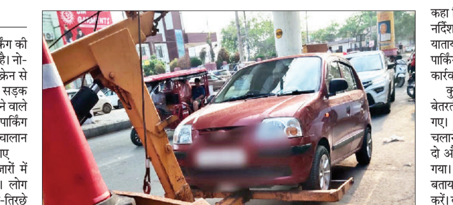
बहादुरगढ़। नो-पार्किंग में खड़ी कार को उतारी क्रेन।

शहर की सड़कों पर व्याप्त अवैध पार्किंग की समस्या पर पुलिस ने सज्ञान ले लिया है। नो-पार्किंग जोन में खड़े होने वाले वाहन क्रेन से उठाए जाएंगे। वीरवार को पुलिस ने सड़क किनारे बेतरतीब ढंग से वाहन खड़े करने वाले लोगों पर शिकंजा कसा। इस दौरान नो-पार्किंग जोन में खड़े 20 वाहन चालकों के चालान किए गए। कई वाहन भी इंपाउंड किए गए। दरअसल, शहर की सड़कों, बाजारों में अवैध पार्किंग की समस्या आम है। लोग सड़क पर नो-पार्किंग जोन में आड़े-तिरछे वाहन खड़े कर देते हैं। इस वजह से सड़क की चौड़ाई घट जाती है और यातायात बाधित हो जाता है। जाम की स्थिति पैदा होने लगती है। इतना ही नहीं, पैदल राहगीरों को भी आने जाने