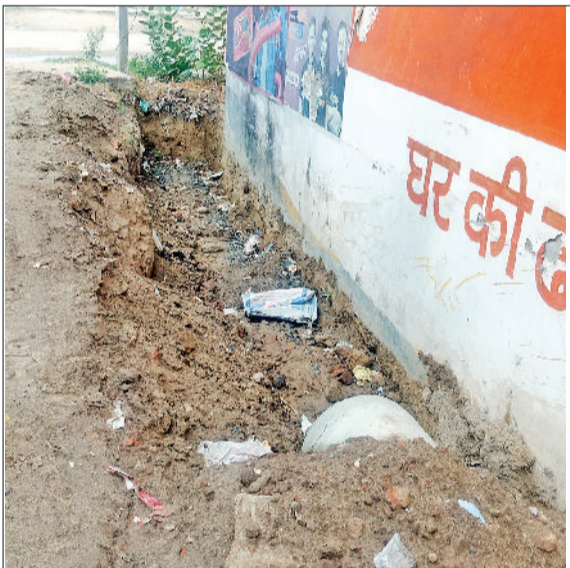
लेवल चैक करवाएं। लेवल ठीक नहीं करवाया तो मुख्य नाले का पानी उनकी गली में दबाए पाइपों में जाना शुरू हो जाएगा।