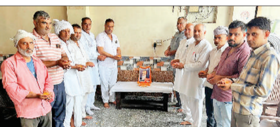
महाराजा रणजीत सिंह के चित्र पर पुष्प अर्पित कर श्रद्धांजलि देते नागरिक।