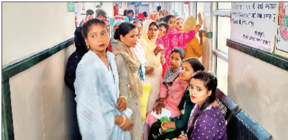
सोनीपत। इंतजार में बैठी महिलाएं।

जिले के नागरिक अस्पताल बृहस्पतिवार दोपहर खी रोग विशेषज्ञ की ओपीडी सवा घंटे बंद रही। काफ़ी देर तक ओपीडी दोबारा शुरू नहीं है। चिकित्सक के आने के इंतजार में लाइन में खड़ी महिलाओं को परेशानी का सामना करना पड़ा। इस दौरान महिलाओं के बीच अपने नंबर आने को लेकर तू-तू मैं-मैं भी हो गई। महिलाओं के झगड़े की सूचना मिलने के बाद दूसरी चिकित्सक को ओपीडी कक्ष में बैठाया गया। दोपहर डेढ़ बजे दोबारा ओपीडी शुरू होने पर महिलाओं को राहत मिल