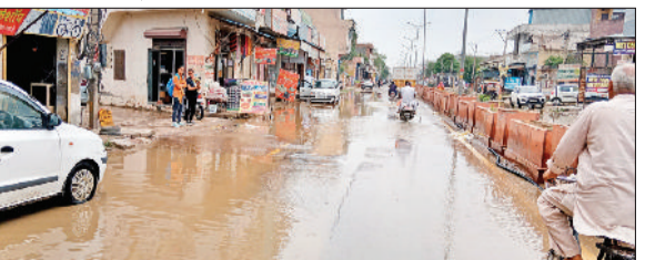
गन्ौर। सुबह हुई बरसात के बाद शाम को रेलवे रोड पर भरा बरसात का पानी।

भी रेलवे रोड देवीलाल चौक से गढ़ी केसरी मोड़ तक ऐसे हालत रहे कि जलभराव के कारण तालाब जैसी स्थिति दिखाई दी। सफाई के ये