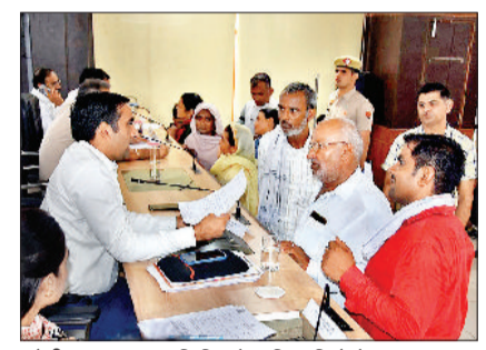
सोनीपत। समाधान शिविर में अधिकारियों के समक्ष अपनी शिकायतें रखते हुए लोग।