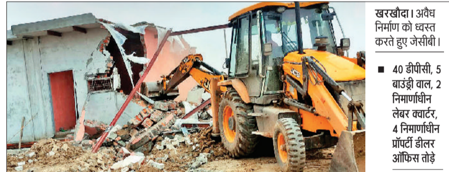
खरखोदा। अवैध निर्माण को ध्वस्त करते हुए जेसीबी।

जिला नगर योजनाकार विभाग द्वारा जिला में विकसित हो रही अवैध कालोनियों तथा अवैध निर्माण को शुरूआत में ही ध्वस्त करने का अभियान चलाया जा रहा है। जिसके तहत गुरुवार को खरखोदा उपमंडल के गांव बरोणा और सोहटी में 19 एकड़ जमीन में विकसित की जा रही अवैध कालोनी को ध्वस्त किया गया। इस दौरान 40 डीपीसी, 5 बाउंड्री वाल, 2 निमाणाधीन लेबर क्वार्टर, 4 निमाणाधीन प्रांण्टी डीलर ऑफिसों को तोड़ा गया। जिला नगर